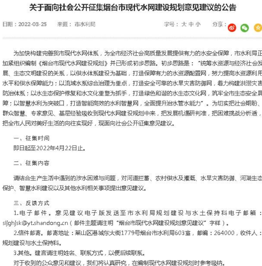
图 4-1 公众参与-网上征求意见建议截图

为提高本规划编制的科学性和针对性，广泛听取各方意见和建议，在规划初步思路形成后，烟台市水利局组织了公众参与会，受新冠疫情影响，最终选择了公众线上参与模式，于2022年3月24日在烟台市政府门户网站发布了“关于面向社会公开征集烟台市现代水网建设规划意见建议的公告”，公告截图如下。