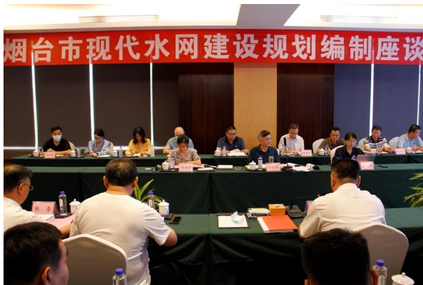
图 4-5 专家咨询会照片

2022年7月24日，水利部水规总院总经济师郦建强一行三人受邀来烟，对规划（初稿）进行了咨询论证，郦建强总经济师介绍了水网规划的由来、编制要求，对烟台现代水网规划工作进行了充分肯定，也提出了一些具体的改进方向和要求。