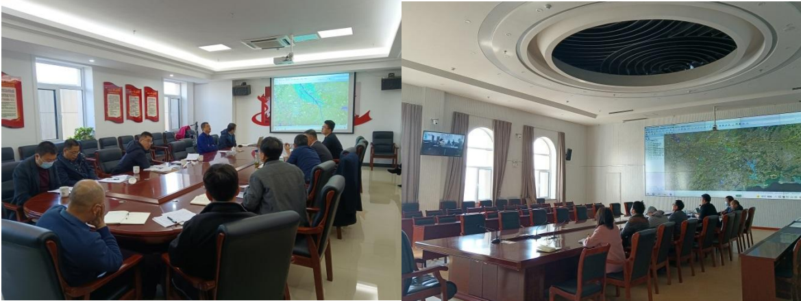
图 4-3 区（市）水利（务）局专题座谈会照片

2022 年 3 月 25 日-4 月 2 日，烟台市水利局组织各区市水利局与规划编制单位进行了专题座谈会，受新冠疫情影响，座谈会采用线上、线上两种方式进行，就水资源供需平衡、规划思路、各区市特点及项目构想等方面进行了深入交流。区市水利局的代表介绍了水资源平衡、重点项目及时间安排、后续实施可能出现的问题及难度等。