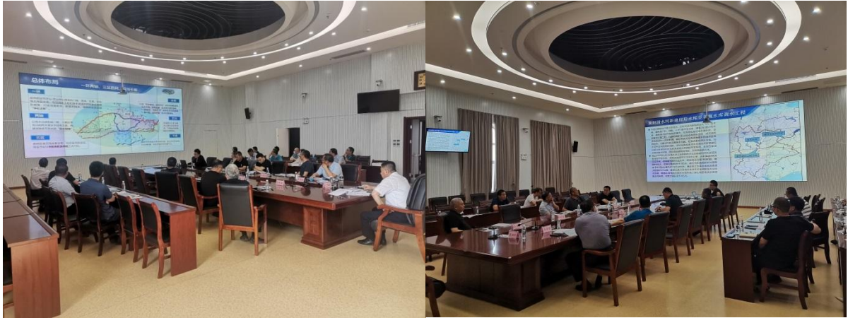
图 4-4 市水利局专题座谈会照片