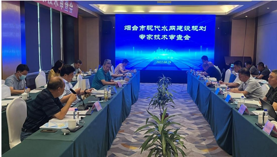
图 4-6 专家评审会照片

会上，专家一致认为规划思路清晰，指导思想、基本原则正确，目标明确，提出的现代水网格局合理，措施可行，能为区域发展提供支撑。专家也对规划提出了意见及建议，由专家意见可以看出，专家更加关注本规划与其他规划的衔接情况及政策机制完善、规范、细化等方面内容。