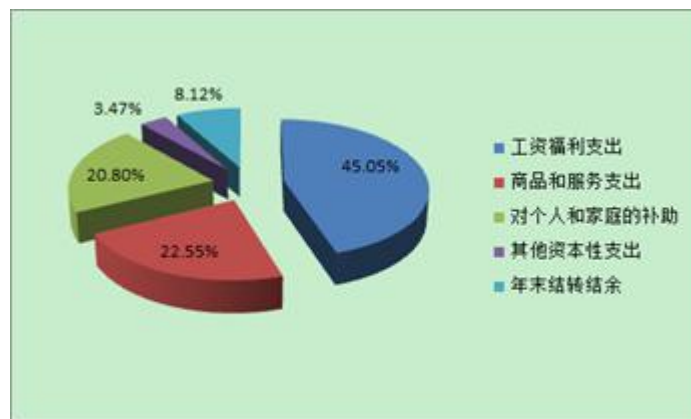
2017年支出结构图(按支出性质和经济分类)

2017年和2016年支出相比增加89.59万元,同比增长22.22%,主要原因是增人导致人员经费及公用经费增加。