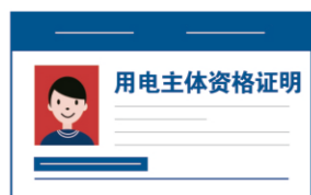
用电主体资格证明