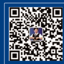
国网山东电力公众号