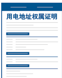
用电地址权属证明